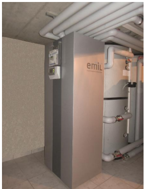
Montagezeit 8 Stunden!

EMIL ist bereits elektrisch und hydraulisch fertig und kann sofort eingebaut und angeschlossen werden. Innerhalb von nur 8 Stunden ist der Heizraum fertig montiert.