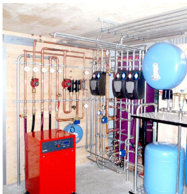
Montagezeit 3-4 Tage.